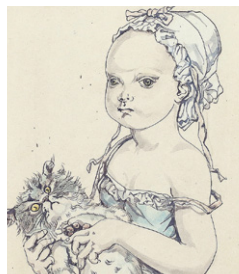
画像：左から 東山 魁夷「明宵」 加山 又造「小羊」 藤田 嗣治「猫を抱く少女」