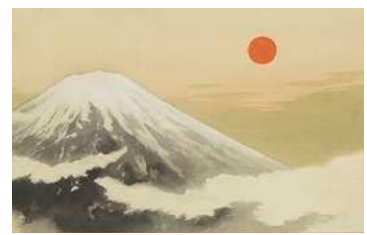
横山大観「耀く日本」