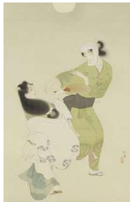
上村松園「盆踊之図」