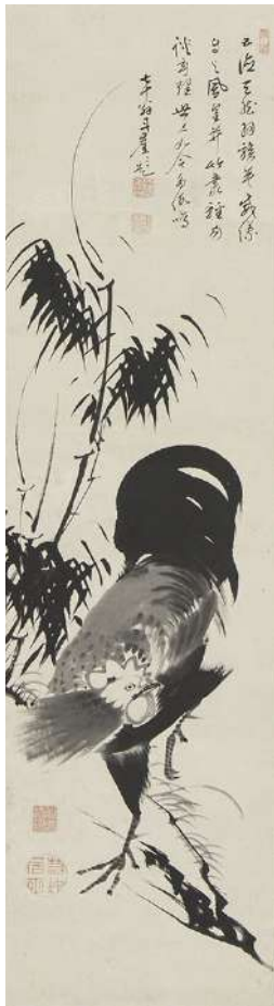
伊藤若沖画 無染浄善賛 「風竹鶏図」