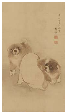
円山應挙「遊狗子図」