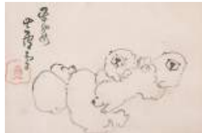
長澤蘆雪「狗児図」 《最低入札価格》¥2,800,000