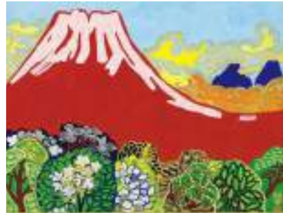
片岡球子「富士」 《最低入札価格》¥8,800,000