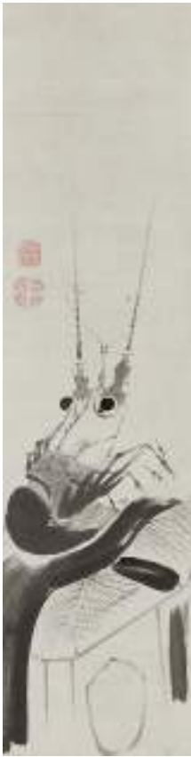
伊藤若冲「伊勢海老図」 《最低入札価格》¥3,500,000