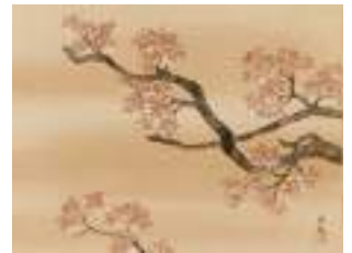
横山大観「國華」 《最低入札価格》¥4,800,000