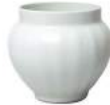
板谷波山「菊形花瓶」 《最低入札価格》¥4,800,000