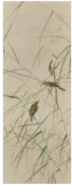
渡邊省亭「行々子」 《最低入札価格》¥1,200,000