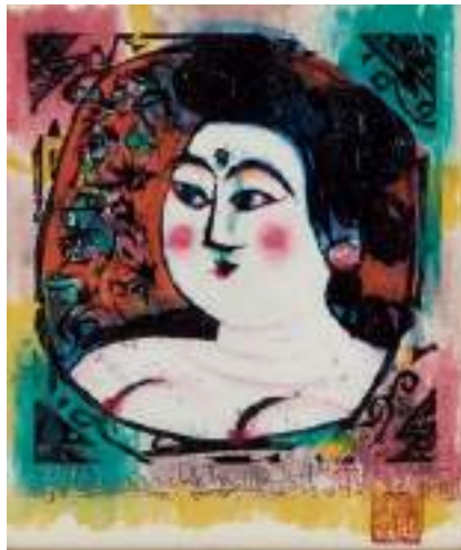
棟方志功「撫子の柵」 《最低入札価格》¥8,000,000