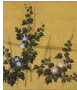
菱田春草「朝顔」 《最低入札価格》¥2,800,000

無二の親友だった横山大観と菱田春草は、日本美術院への参加や西欧への外遊など常に苦楽を共にし、春草が 36 歳で早逝するまで盟友として互いを高め合いました。六歳下の春草を師のように敬慕していたという大観は、晩年まで春草の才を称え、惜しんだといひます。近代日本画の誕生を支えた巨匠二人の作品をご紹介します。