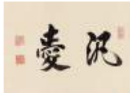
徳川慶喜「汎愛」 《最低入札価格》¥880,000