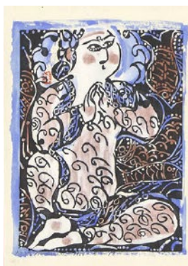
棟方 志功《御母恩之柵》