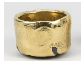
十二代 三輪 休雪《オーロラ盃》