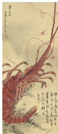
長澤 蘆雪画 大原 吞響賛 《海老画賛》