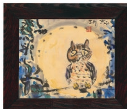
棟方 志功《みみずく図》