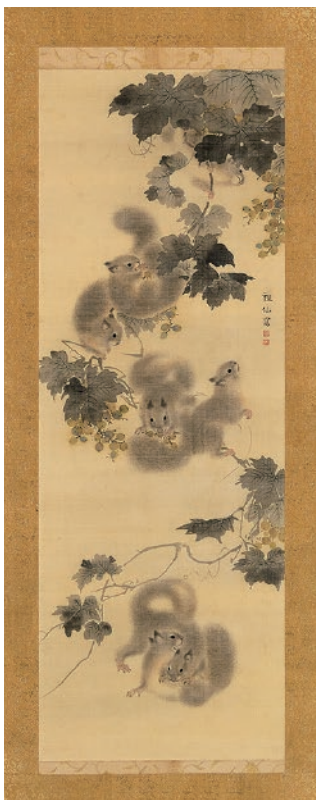
森 祖仙《葡萄栗鼠図》