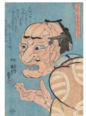
歌川国芳《みかけハこハみがとんだいゝ人だ》