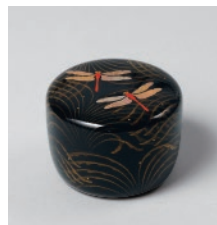
松田 権六《赤とんぼ時絵平糞》