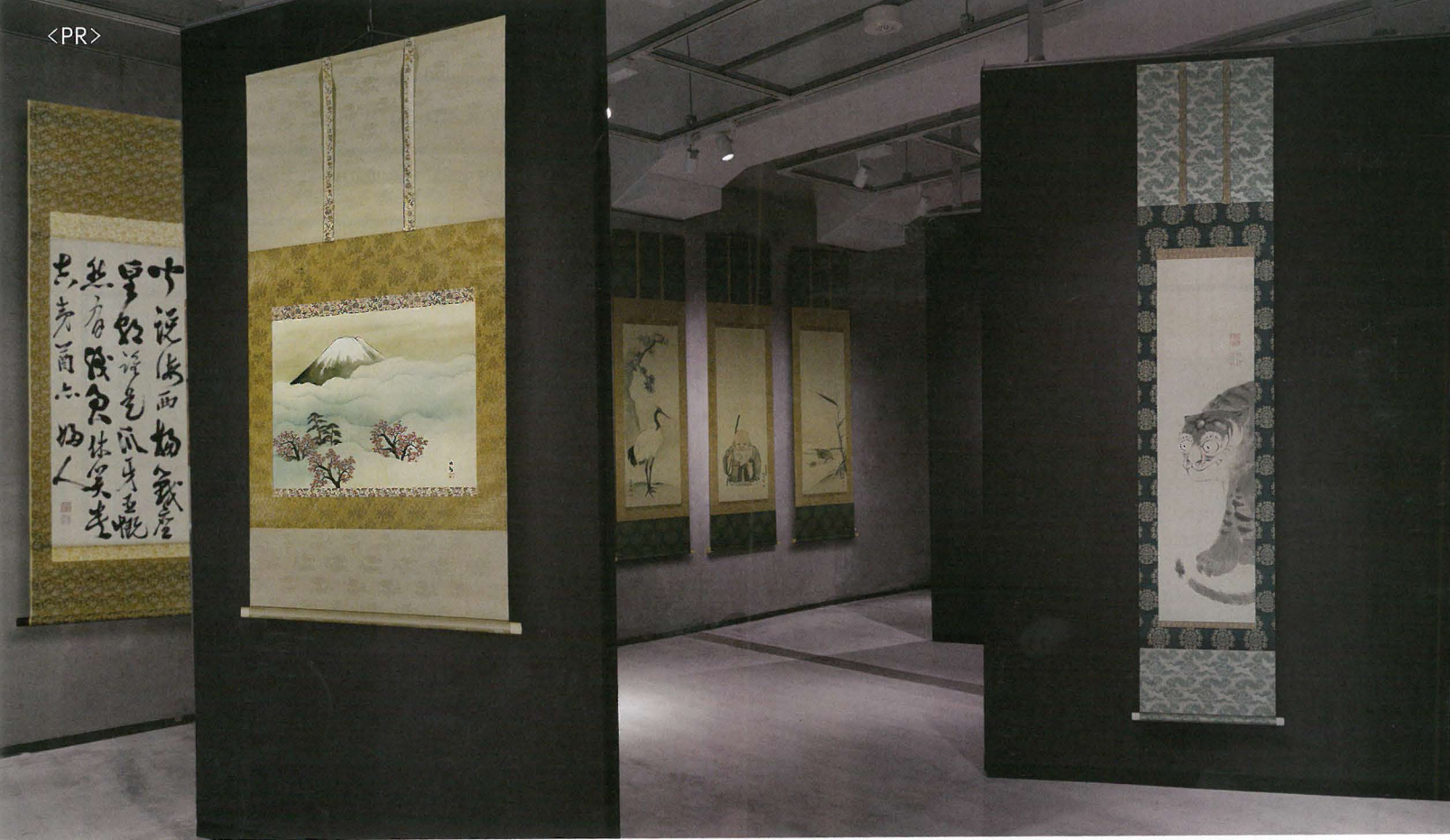
伊藤若冲、西郷隆盛等の名品が一堂に会する「美祭」。